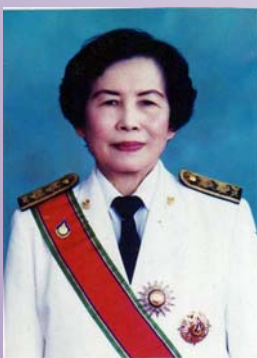
สวัสดีค่ะ

สมาชิกและผู้สนใจ สามารถติดตามรายละเอียดท่านสามารถอ่านได้จากข่าวสมาคมห้องสมุดในฉบับนี้ค่ะ